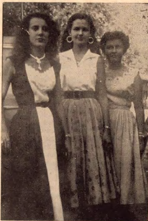
Tres de las beldades que realzaron los festejos populares de Puntarenas. Señorita Puerto Cortés, Señorita Puntarenas, Señorita Quepos. Tres maravillosas flores del jardín femenino costarricense.